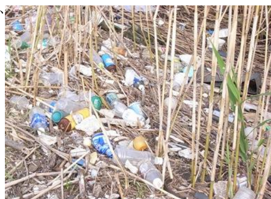
ヨシ原を覆うペットボトルゴミ

※ 荒川でゴミを拾って自然を戻す活動「荒川クリーンエイド」は、2010年で17年目を迎えています。2010年は8月までに34会場で約3000人以上が参加してゴミ拾いが実施されました。9月以降12月までに荒川河川敷の75以上の会場でゴミ拾い・ゴミ調査が実施される予定です。