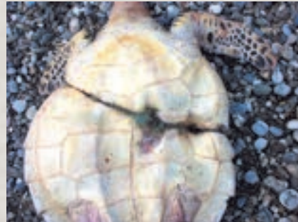
左●荒川に散乱する様々なごみ 右●ウミガメにごみからみついた様子