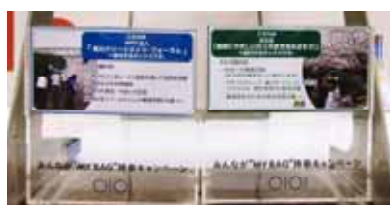
荒川クリーンエイドの投票ボックス