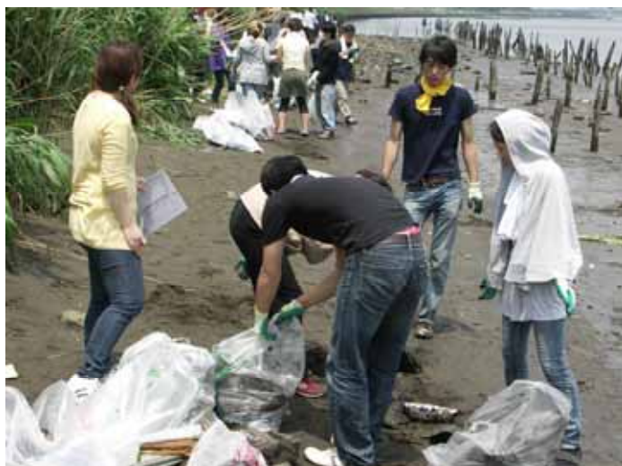
荒川クリーンエイド2009春の会場から

10人以上で参加されたい場合は、実施団体、または荒川クリーンエイド事務局にお問合せください。